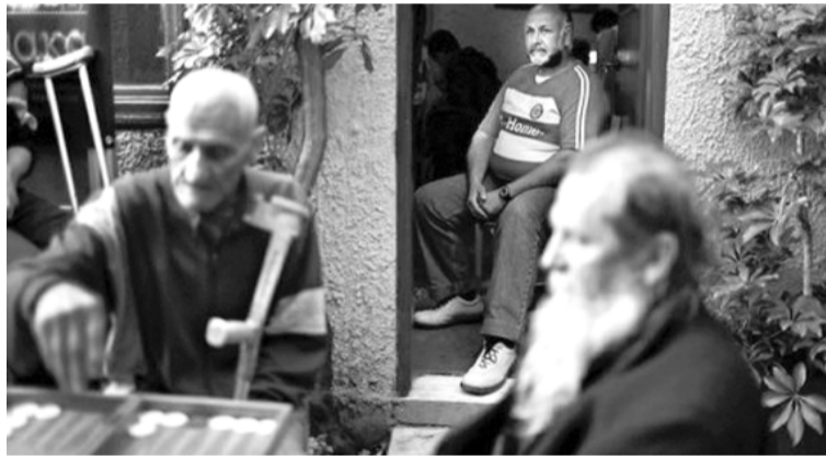
Στο καταφύγιο αστέγων της Κλίμακας.

παραβατικότητας και εγκληματικών πρακτικών, οπότε το Σχέδιο μοιάζει αυτονόητο, ευπρόσδεκτο, σχεδόν φυσικό.